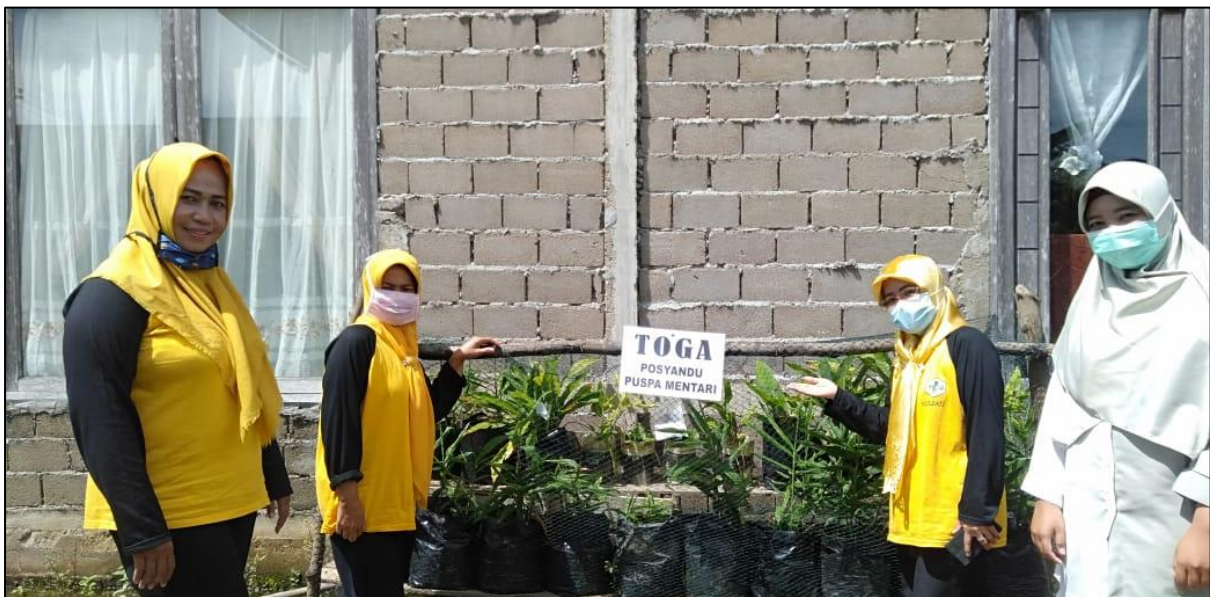
Gambar 03 Stimulus bantuan bibit dan ternak bagi kader posyandu untuk bahan baku PMT dan wirausaha