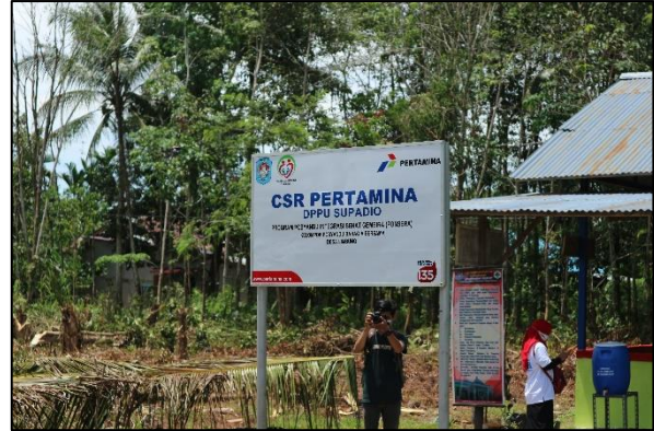
Gambar 02-03 Perbaikan fasilitas kesehatan oleh Pertamina sebagai upaya peningkatan layanan kepada masyarakat